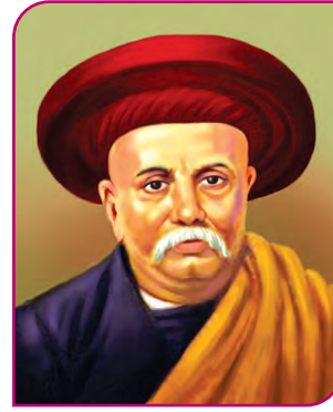
डॉ.भाऊ दाजी लाड

कोलकाता येथे ब्रिटिशांनी 'एशियाटिक सोसायटी'ची स्थापना केली. अनेक भारतीय व पाश्चिमात्य विद्वानांनी भारतीय संस्कृतीचा अभ्यास सुरू केला. संस्कृत, फारसी आणि अन्य भारतीय भाषांमधील हस्तलिखिते तपासून त्यावरील संशोधने प्रसिद्ध केली. डॉ. भाऊ दाजी लाड, डॉ. रा.गो. भांडारकर अशा काही भारतीय विद्वानांनी प्राचीन भारतीय संस्कृतीचा सखोल अभ्यास केला. आपल्याला प्राचीन समृद्ध वारसा लाभला आहे हे समजल्याने भारतीयांची अस्मिता जागृत झाली. पुणे येथे 'भांडारकर प्राच्यविद्या संशोधन मंदिर' ही संस्था गेल्या शंभर वर्षांपासून कार्यरत आहे.