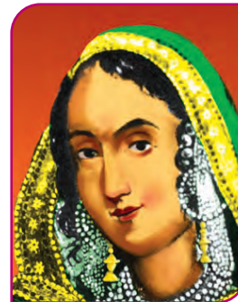
बेगम हजरत महल