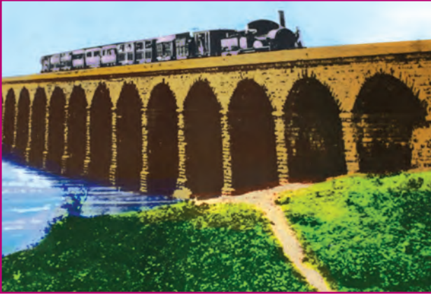
मुंबई-ठाणे रेल्वे (१८५३)

वाहतूक व दळणवळण व्यवस्थेत सुधारणा : इंग्रजांनी व्यापारवृद्धी आणि प्रशासनाची सोय यांसाठी भारतात वाहतूक व दळणवळण यांच्या आधुनिक सोईसुविधा निर्माण केल्या. त्यांनी कोलकाता व दिल्ली यांना जोडणारा महामार्ग बांधला. १८५३ साली मुंबई-ठाणे रेल्वे मार्गावर आगगाडी धावू लागली. त्याच वर्षी तारायंत्राद्वारे संदेश पाठवण्याची यंत्रणा इंग्रजांनी भारतात सुरू केली. या यंत्रणेने भारतातील प्रमुख शहरे आणि लष्करी ठाणी एकमेकांना जोडली गेली. त्याचप्रमाणे इंग्रजांनी डाकव्यवस्थाही सुरू केली.