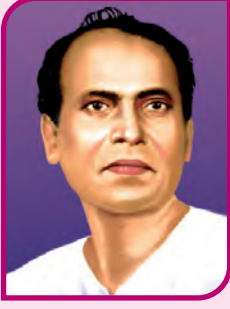
लोकशाहीर अण्णाभाऊ साठे