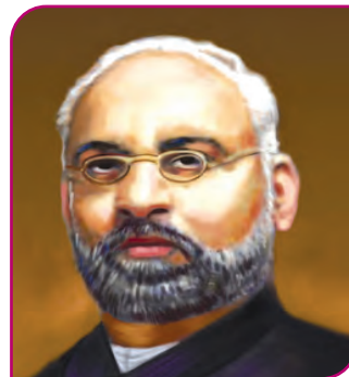
पं.श्यामजी कृष्ण वर्मा

इंडिया हाउस : भारतातील क्रांतिकार्याला परदेशातील भारतीय क्रांतिकारकांकडून साहाय्य मिळत असे. लंडन येथील इंडिया हाउस हे अशा साहाय्याचे महत्त्वाचे केंद्र होते. पं.श्यामजी कृष्ण वर्मा या भारतीय देशभक्ताने इंडिया हाउसची स्थापना केली होती. या संस्थेमार्फत भारतीय तरुणांना इंग्लंडमध्ये उच्च शिक्षण घेण्यासाठी शिष्यवृत्त्या दिल्या जात असत. स्वातंत्र्यवीर सावरकरांना अशी शिष्यवृत्ती मिळाली होती. मादाम कामा यांनी जर्मनीत स्टुटगार्ड