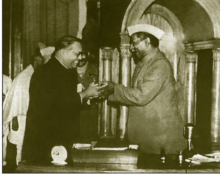
भारतीय संविधानाचा मसुदा संविधान सभेचे अध्यक्ष डॉ.राजेंद्रप्रसाद यांना सादर करताना डॉ.बाबासाहेब आंबेडकर