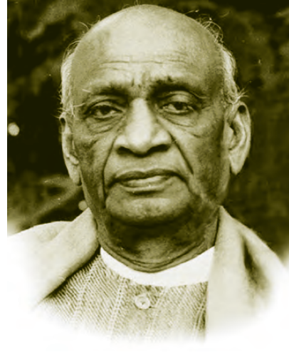
सरदार वल्लभभाई पटेल