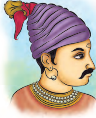
छत्रपती राजाराम महाराज

महाराज : राजाराम महाराज हे छत्रपती शिवाजी महाराजांचे द्वितीय पुत्र होत. त्यांचा जन्म २४ फेब्रुवारी १६७० रोजी रायगडावर झाला.