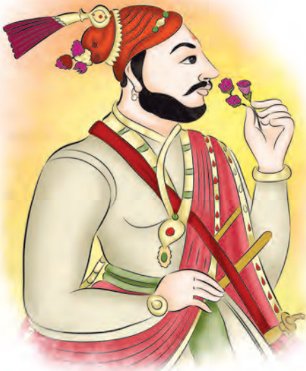
छत्रपती संभाजी महाराज

छत्रपती संभाजी महाराज: संभाजी महाराज हे छत्रपती शिवाजी महाराजांचे ज्येष्ठ पुत्र होत. त्यांचा