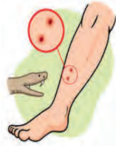
४.११ : सर्पदंशावर उपाय