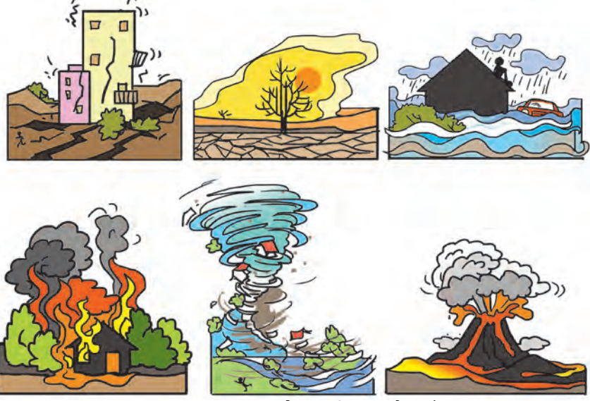
४.१ : सभोवताली घडणारे प्रसंग

● १९९३ मध्ये लातूर जिल्ह्यातील किल्लारी परिसरात तीव्र भूकंप झाल्याने हजारो लोकांचा मृत्यू झाला होता.