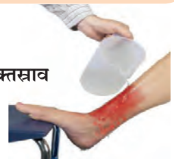
४.८ : रक्तस्राव

रक्तस्राव झालेल्या व्यक्तीस आराम वाटेल अशा पद्धतीने बसवा अथवा झोपवा. रक्तस्राव होणारा अवयव हृदयाच्या स्तरापेक्षा उंच ठेवून जखम पाण्याने स्वच्छ करावी.