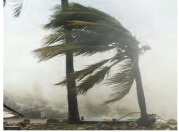
४.५ : वादळ