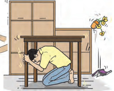
४.७ : उपाययोजना