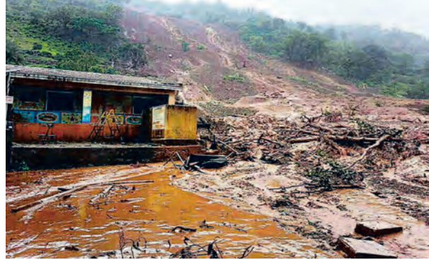
४.३ : माळीण गाव दुर्घटना

● नोव्हेंबर २०१५ मध्ये तमिळनाडूत झालेल्या अतिवृष्टीने अनेक लोक मृत्युमुखी पडले.