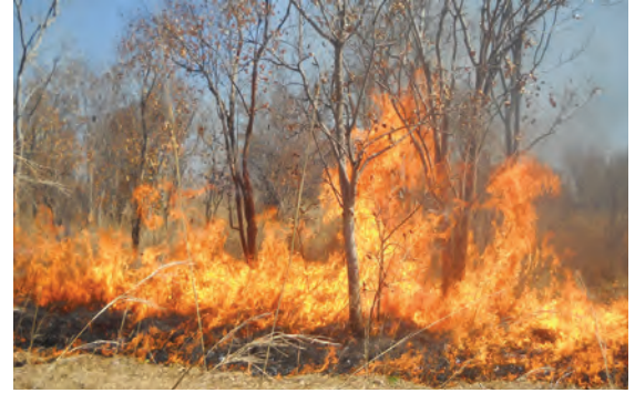
४.६ : वणवा