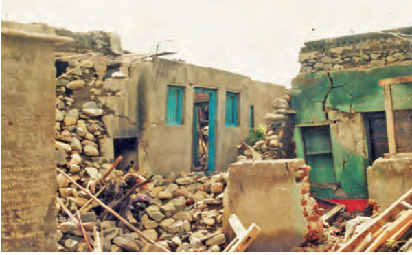
४.२ : किल्लारी भूकंप

● जुलै २००५ आठवला, की आजही मुंबईकरांच्या अंगावर काटा उभा राहतो, कारण त्या वेळी मुसळधार पावसाने नदीचे पाणी तुंबल्याने महापूर येऊन लोकांचे बळी गेले.