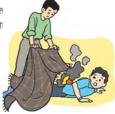
४.९ : भाजणे, पोळणे यांवर उपाय