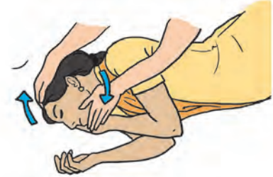
४.१० : उष्माघातावर उपाय