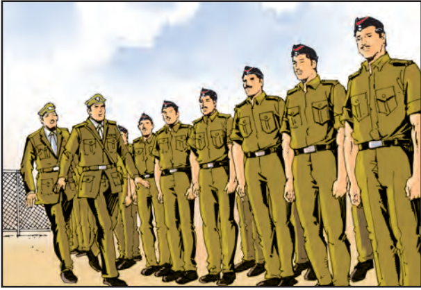
पोलीस अधीक्षक पोलीस दलाची पाहणी करताना

महाराष्ट्रात प्रत्येक जिल्ह्याच्या ठिकाणी एक पोलीस अधीक्षक असतो. त्या जिल्ह्याचा तो प्रमुख पोलीस अधिकारी असतो. जिल्ह्यात शांतता व सुव्यवस्था राखण्यासाठी जिल्हा पोलीसप्रमुख जिल्हाधिकाऱ्यांना मदत करतात. शहरात शांतता व सुव्यवस्था राखण्याची जबाबदारी पोलीस आयुक्तांवर असते.