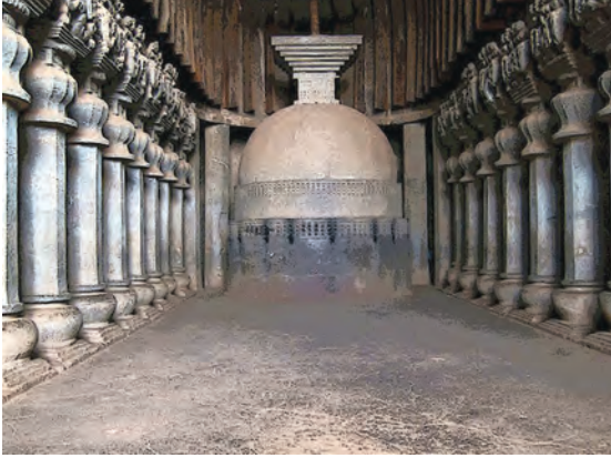
कार्ले येथील चैत्यगृह