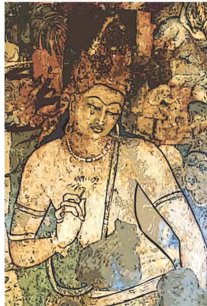
अजिंठा येथील एक लेणे

त्याने खोदवून घेतले होते. अजिंठ्याच्या इतरही काही लेण्यांमधील खोदाईचे, तसेच ती लेणी चित्रांनी सुशोभित करण्याचे काम हरिषेणाच्या कारकिर्दीत झाले. वाकाटक राजा दुसरा प्रवरसेन याने 'महाराष्ट्री' या प्राकृत भाषेतील