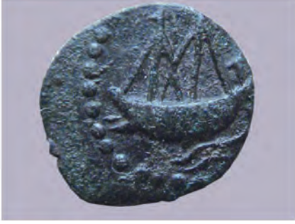
जहाजाची प्रतिमा असलेले सातवाहन नाणे

असे. काही सातवाहन नाण्यांवर जहाजाच्या प्रतिमा आहेत. महाराष्ट्रातील अजिंठा, नाशिक, कार्ले, भाजे, कान्हेरी, जुन्नर येथील लेण्यांमधील काही लेणी सातवाहनांच्या काळात खोदलेली आहेत.