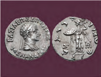
मिलिंदपञ्च - मिन्डर

या काळात भारतीय उपखंडाच्या वायव्य प्रदेशामध्ये ग्रीक राजांची छोटी छोटी राज्ये होती. त्या राजांना 'इंडो-ग्रीक राजे' असे म्हटले जाते. प्राचीन भारतीय नाण्यांच्या इतिहासात या राजांची नाणी अत्यंत महत्त्वाची आहेत. एका बाजूवर राजाचे चित्र आणि दुसऱ्या बाजूला देवतेचे चित्र अशा पद्धतीची नाणी बनवण्याची त्यांची परंपरा होती. ती पुढे भारतात रुजली. इंडो-ग्रीक राजांमध्ये मिन्डर हा राजा प्रसिद्ध असून त्याने नागसेन या बौद्ध भिक्खूबरोबर बौद्ध तत्त्वज्ञानाची चर्चा केली होती. मिन्डर म्हणजेच मिलिंद. त्याने भिक्खू नागसेन यांना विचारलेल्या प्रश्नांतून 'मिलिंदपञ्च' या ग्रंथाची निर्मिती झाली. 'पञ्च' या पाली भाषेतील शब्दाचा अर्थ 'प्रश्न' असा होतो.