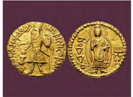
कनिष्काचे सोन्याचे नाणे-दोन्ही बाजू

सम्राट कनिष्क : कनिष्काचे साम्राज्य पश्चिमेला काबूलपासून पूर्वेला वाराणसीपर्यंत पसरले होते. कनिष्काची सोन्याची आणि तांब्याची नाणी सापडली आहेत. कनिष्काच्या काळात बौद्ध धर्माची चौथी परिषद काश्मीरमध्ये भरवण्यात आली होती. कनिष्काने काश्मीरमध्ये कनिष्कपूर हे शहर वसवले होते. श्रीनगरजवळ असलेले काम्पूर नावाचे गाव म्हणजेच कनिष्कपूर असावे. कनिष्काच्या काळात अश्वघोष हा कवी होऊन गेला. त्याने 'बुद्धचरित' आणि 'वज्रसूचि' हे ग्रंथ लिहिले. कनिष्काच्या दरबारात चरक हा प्रसिद्ध वैद्य होता.