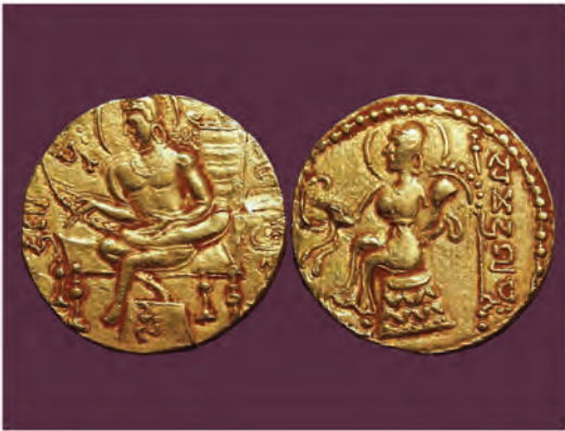
समुद्रगुप्ताने काढलेली नाणी - गुप्त

समुद्रगुप्त : पहिला चंद्रगुप्त या गुप्त राजाच्या कारकिर्दीत गुप्तांच्या राज्यविस्ताराची सुरुवात झाली. त्याचा मुलगा समुद्रगुप्त याने आसपासच्या राजांचा पराभव करून हा विस्तार आणखी वाढवला. त्याच्या कारकिर्दीत गुप्त सत्ता आसामपासून पंजाबपर्यंत पसरली होती. तमिळनाडूमधील कांचीपर्यंतचा पूर्व किनारपट्टीचा प्रदेशही त्याने जिंकला होता. समुद्रगुप्ताने मिळवलेल्या विजयांमुळे त्याच्या सत्तेचा दबदबा सर्वत्र वाढला होता. त्यामुळे वायव्येकडील राजे, तसेच श्रीलंकेतील राजा यांनीही त्याच्याशी मैत्रीचे करार केले. समुद्रगुप्ताचा पराक्रम आणि त्याने मिळवलेले विजय यांचे वर्णन प्रयागच्या स्तंभलेखात सविस्तर दिलेले आहे. हा लेख 'प्रयागप्रशस्ति' म्हणून ओळखला जातो. त्याला 'अलाहाबाद प्रशस्ती' असेही म्हणतात. समुद्रगुप्त वीणावादनात प्रवीण होता. समुद्रगुप्ताने विविध प्रकारच्या प्रतिमा असलेली नाणी काढली होती. त्यांतील एका प्रकारात तो स्वतः वीणा वाजवताना