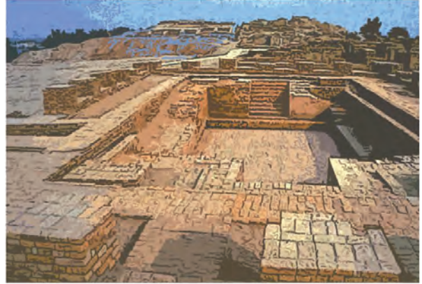
मोहेंजोदडो येथील महास्नानगृह

मोहेंजोदडो येथे एक प्रशस्त स्नानगृह सापडले आहे. महास्नानगृहातील स्नानकुंड जवळजवळ २.५ मीटर खोल होते. त्याची लांबी सुमारे १२ मीटर आणि रुंदी सुमारे ७ मीटर होती. कुंडातील पाणी झिरपून जाऊ नये म्हणून ते आतून पक्क्या विटांनी बांधलेले होते. त्यात उतरण्यासाठी व्यवस्था होती. तसेच त्यातील पाणी वेळोवेळी बदलण्याची सोय होती.