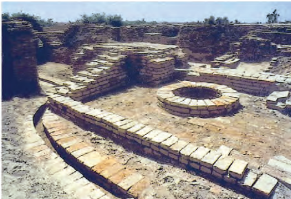
हडप्पा संस्कृतीतील विहीर

हडप्पा संस्कृतीच्या लोकांची घरे आणि इतर बांधकामे प्रामुख्याने भाजक्या विटांची होती. काही ठिकाणी कच्च्या विटा आणि दगडांचा वापरही बांधकामासाठी केला जाई. मधोमध चौक आणि त्याभोवती खोल्या अशा प्रकारची घरांची रचना असे. घरांच्या आवारात विहिरी, स्नानगृहे, शौचालये असत. सांडपाणी वाहून नेण्याची उत्तम व्यवस्था असे. त्यासाठी मातीच्या भाजक्या पन्हाळींचा उपयोग केला जाई. रस्त्यावरील गटारे विटांनी बांधून काढलेली असत. ती झाकलेली असत. यावरून सार्वजनिक आरोग्याबद्दल ते किती जागरूक होते ते दिसते.