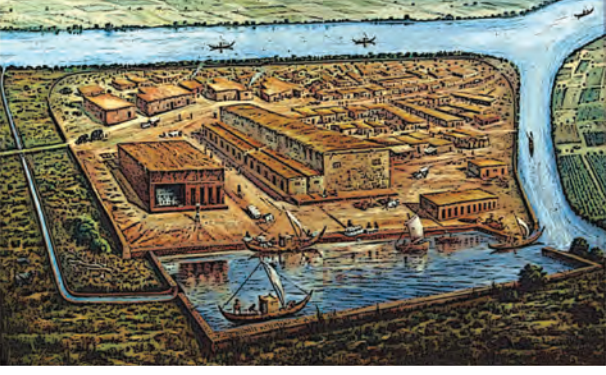
लोथल येथील गोदी (अवशेषांच्या आधारे पुनर्रचना)