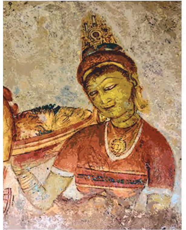
सिगिरिया लेण्यांतील भित्तिचित्र

श्रीलंका : बौद्ध धर्माचा प्रसार करण्यासाठी सम्राट