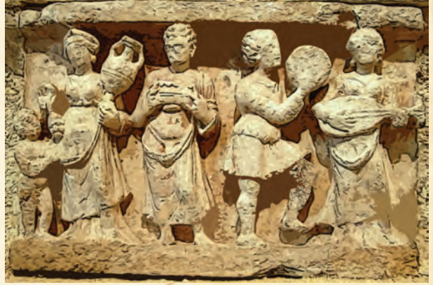
अफगाणिस्तानमधील हड्डा येथील स्तूपावरचे गांधार शैलीचे शिल्प. ग्रीक लोकांचा पोशाख, अँफोरा (एकप्रकारचा कुंभ) आणि वाद्ये

सापडल्या, म्हणून त्या शैलीस 'गांधार शैली' असे म्हटले जाते. या शैलीतील मूर्तींची चेहरेपट्टी ग्रीक चेहरेपट्टीशी मिळतीजुळती आहे. भारतातील सुरुवातीची नाणीही ग्रीक नाण्यांच्या धर्तीवर घडवलेली होती.