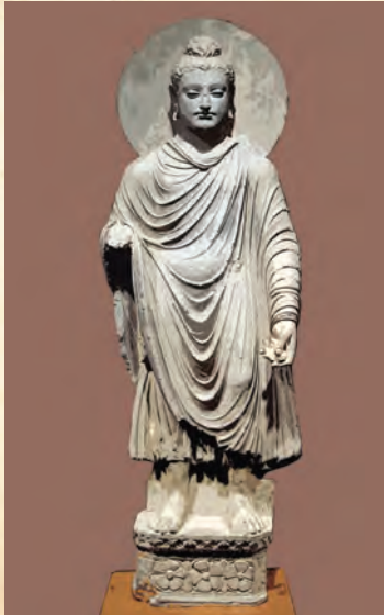
पॅरिस येथील संग्रहालयातील गौतम बुद्धांची मूर्ती-गांधार शैली

इसवी सनाच्या पहिल्या-दुसऱ्या शतकाच्या काळात भारत आणि रोम यांच्यामधील व्यापार भरभराटीस आला होता. या व्यापारात दक्षिण भारतातील बंदरांचाही मोठा वाटा होता. महाराष्ट्रातील कोल्हापूर येथील उत्खननात कासे या धातूच्या काही वस्तू सापडल्या. त्या रोमन बनावटीच्या आहेत.