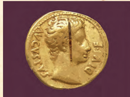
रोमन सम्राट ऑगस्टस याचे अरिकामेडू येथे मिळालेले सोन्याचे नाणे

तमिळनाडूमधील अरिकामेडू येथील उत्खननातही रोमन बनावटीच्या अनेक वस्तू सापडल्या आहेत. दोन्ही