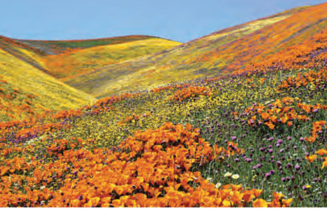
व्हॅली ऑफ फ्लॉवर्स

भौगोलिक वैशिष्ट्यपूर्ण स्थळे (उदा., लोणार सरोवर, निघोज येथील रांजणखळगे, इत्यादी) इत्यादींचा समावेश भौगोलिक पर्यटनात होतो. यातील अनेक स्थळांमधील निसर्गाचे अवलोकन करावे या इच्छेपोटी आणि कुतुहलापोटी अनेक पर्यटक तिथे जात असतात.