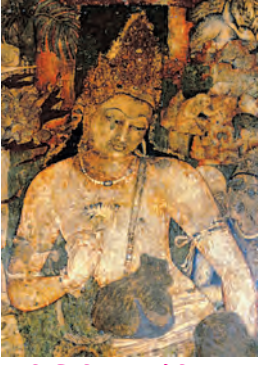
भित्तिचित्र : बोधिसत्त्व पद्मपाणि

दृक्कलांमध्ये चित्रकला आणि शिल्पकला यांचा समावेश होतो.