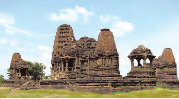
गोंदेश्वर मंदिर - सिन्नर

महाराष्ट्रातील बाराव्या-तेराव्या शतकातील मंदिरांना 'हेमाडपंती' मंदिरे असे म्हणतात. हेमाडपंती मंदिराच्या बाह्य भिंती बऱ्याचदा तारकाकृती असतात. तारकाकृती मंदिराच्या बांधणीत मंदिराची बाह्य भिंत अनेक कोनांमध्ये विभागली जाते. त्यामुळे त्या भिंती आणि त्यावरील शिल्पे यांच्यावर छायाप्रकाशाचा सुंदर परिणाम पाहण्यास मिळतो. हेमाडपंती मंदिरांचे महत्त्वाचे वैशिष्ट्य म्हणजे भिंतीचे दगड सांधण्यासाठी चुना वापरलेला नसतो. दगडांमध्येच एकमेकांत घट्ट बसतील अशा कातलेल्या खोबणी आणि कुसू यांच्या आधाराने भिंत उभारली जाते. मुंबईजवळील अंबरनाथ येथील अंब्रेश्वर, नाशिकजवळचे सिन्नर येथील गोंदेश्वर, हिंगोली जिल्ह्यातील औंढा नागनाथ ही हेमाडपंती मंदिराची उत्तम उदाहरणे आहेत. त्यांची बांधणी तारकाकृती प्रकारची आहे. त्याखेरीज महाराष्ट्रात अनेक ठिकाणी हेमाडपंती मंदिरे पहावयास मिळतात.