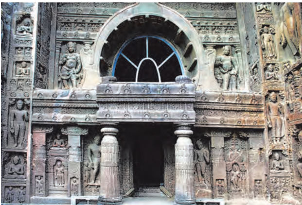
अजिंठा लेणे क्र. १९ प्रवेशद्वार

स्थापत्य आणि शिल्पकला : भारतामध्ये अनेक कोरीव लेणी आहेत. कोरीव लेण्यांची परंपरा भारतामध्ये इसवी सनापूर्वी तिसऱ्या शतकात सुरू झाली. तांत्रिकदृष्ट्या संपूर्ण लेणे हे स्थापत्य आणि कोरीव शिल्पाचे एकत्रित उदाहरण असते. प्रवेशद्वारे, आतील खांब आणि मूर्ती हे शिल्पकलेचे उत्तम नमुने असतात. भिंती आणि छत यांवर केलेले उत्तम चित्रकाम काही लेण्यांमध्ये अजूनही काही प्रमाणात टिकून आहे. महाराष्ट्रातील अजिंठा आणि वेरूळ