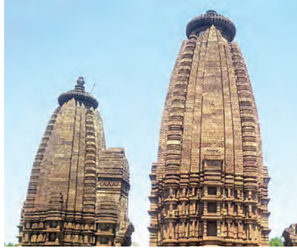
नागर शैलीचे शिखर

मंदिर स्थापत्य पूर्ण विकसित झाले होते, हे वेरूळ येथील कैलास मंदिराच्या भव्य रचनेवरून सहज लक्षात येते. मध्ययुगीन