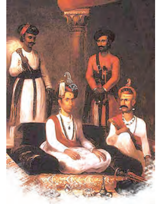
सवाई माधवराव आणि नाना फडणवीस

दिसतो. पुण्यातील शनिवारवाड्यात सवाई माधवराव पेशव्यांच्या काळात जेम्स वेल्स या स्कॉटिश चित्रकाराच्या नेतृत्वाखाली एक कलाशाळा स्थापन करण्यात आली होती. त्याने सवाई माधवराव आणि नाना फडणवीस यांचे चित्र काढले होते. वेल्सच्या सोबत काम करणारे एक मराठी