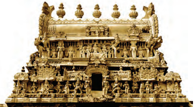
द्राविड शैलीचे गोपूर

काळापर्यंत भारतीय मंदिर स्थापत्याच्या अनेक शैली विकसित झाल्या. शिखरांच्या रचना वैशिष्ट्यांनुसार या शैली ठरतात. त्यामध्ये उत्तर भारतातील 'नागर' आणि दक्षिण भारतातील 'द्राविड' या दोन शैली प्रमुख मानल्या जातात. या दोहोंमधून विकसित झालेल्या मिश्र शैलीला 'वेसर' असे म्हटले जाते. मध्य प्रदेश आणि महाराष्ट्रात आढळणारी 'भूमिज' मंदिरशैली आणि 'नागर' मंदिरशैली यांच्यामध्ये रचनेच्या दृष्टीने साम्य आढळते. भूमिज शैलीत क्रमशः लहान होत जाणाऱ्या शिखरांच्या प्रतिकृती वरपर्यंत रचलेल्या असतात.