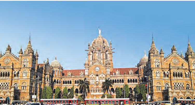
छत्रपती शिवाजी महाराज रेल्वे टर्मिनस

भारतात ब्रिटिश सत्ता प्रस्थापित झाल्यानंतर एक नवीन स्थापत्यशैली उदयाला आली. तिला इंडो-गोथिक स्थापत्यशैली असे म्हटले जाते. ब्रिटिश काळात बांधल्या गेलेल्या चर्च, सरकारी कचेऱ्या, मोठ्या पदाधिकाऱ्यांची निवासस्थाने, रेल्वे स्टेशन यांसारख्या इमारतींमध्ये ही शैली पहावयास मिळते.