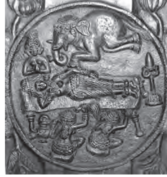
भारतूत स्तूप : शिल्प

संस्कृतीमधील मुद्रा, दगडी आणि कांस्य पुतळे पाच हजार वर्षे किंवा त्यापेक्षा अधिक प्राचीन असलेल्या भारतीय शिल्पकलेच्या परंपरेची साक्ष देतात. मौर्य सम्राट अशोकाच्या काळातील दगडी स्तंभांपासून भारतातील कोरीव दगडी शिल्पनिर्मितीला खऱ्या