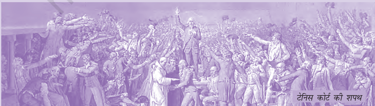
टेनिस कोर्ट की शपथ