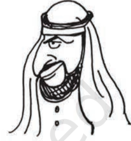
शेख पैट्रो डॉलर-उल्ला काला सोना मुल्क के सुल्तान

बेशकीमती चीजों की मैं कद्र करता हूँ। बिग ऑयल कहते हैं कि उनके राष्ट्रपति आजादी और जम्हूरियत को बड़ा कीमती मानते हैं इसीलिए मैंने भी अपने मुल्क में आजादी और जम्हूरियत को सात तालों के भीतर बंद करके रखा है।