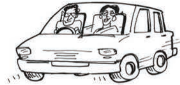
श्री एवं श्रीमती बड़बोले