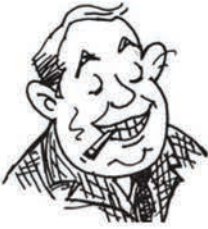
जनाब बिग ऑयल बिग ऑयल एंड संस के सीईओ

एक दिन मैंने खुद से पूछा कि आखिर मैं अपने मुल्क के किस काम आ सकता हूँ। मेरे मुल्क में तेल की भूख विकट है। वह कभी खत्म होने का नाम नहीं लेती, चलो, तो फिर तेल का इंतजाम करते हैं। मैं बाजार की आजादी का हामी हूँ। मतलब यह कि दूर के देशों में तेल के कुएँ खोदने की आजादी; धरती की आबो-हवा को मटियामेंट करने की आजादी और ऐसे कठपुतले तानाशाहों की ताजपोशी की आजादी जो अपनी ही जनता पर कोड़े फटकारे।