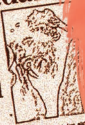
A weary frame of last night's battle.

Dhola, Khinzemane posts abandoned Chinese advance pushed at heavy cost