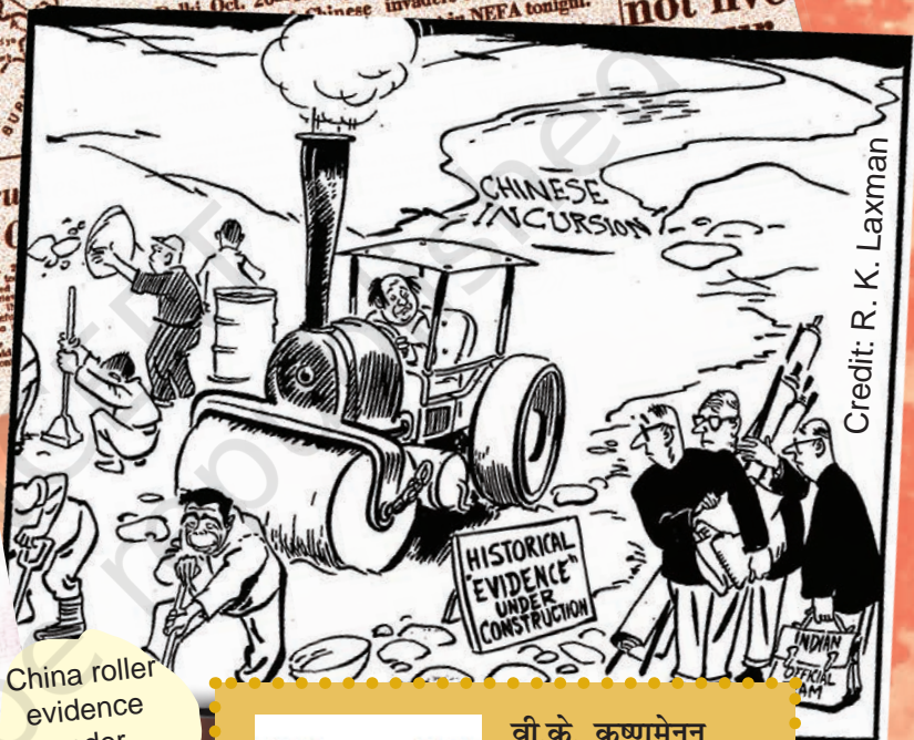
China roller evidence under construction.