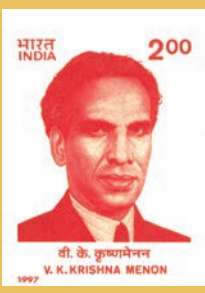
भारत INDIA 200 वी. के. कृष्णामेनन V. K. KRISHNA MENON

दो भारतीय चौकियों का पतन एक भारतीय हेलिकॉप्टर को मार गिराया चीनियों से अंत तक कान्बला होगा