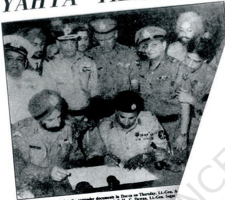
Gen. A. A. K. Niazi signing the surrender documents in Dacca on Thursday. Lt.-Gen. ... ing from left are Vice Admiral Krishnan, Air Marshal H. C. Dewan, Lt.-Gen. Sagar

Somersault by General as hails Delhi keeps out