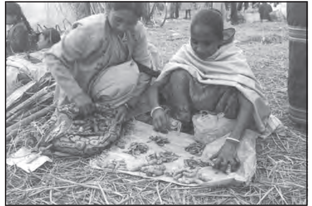
चित्र संख्या 8.1 : जॉन बीलमेला में वस्तुओं का आदान-प्रदान करती दो महिलाएँ

आदिम समाज में व्यापार का आरंभिक स्वरूप 'विनिमय व्यवस्था' था, जिसमें वस्तुओं का प्रत्यक्ष आदान-प्रदान होता था अर्थात् वस्तु के बदले में रुपये के स्थान पर वस्तु दी जाती थी। इस व्यवस्था में यदि आप एक कुम्हार होते और आपको एक नलसाज की आवश्यकता होती, तो आपको एक ऐसा नलसाज ढूँढ़ना पड़ता, जिसे आप द्वारा बनाए हुए बर्तनों की आवश्यकता होती और आप उसकी नलसाज की सेवाओं के बदले अपने बर्तन देकर आदान-प्रदान कर सकते थे।