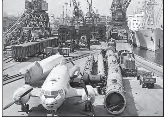
चित्र 8.5 : लेनिनग्राद का वाणिज्यिक पत्तन