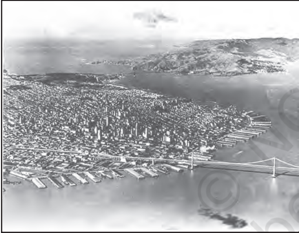
चित्र 8.4 : सैन फ्रांसिस्को, विश्व का सबसे बड़ा स्थलरुद्ध पत्तन

पत्तन जहाज़ के लिए गोदी, लादने, उतारने तथा भंडारण हेतु सुविधाएँ प्रदान करते हैं। इन सुविधाओं को प्रदान करने के उद्देश्य से पत्तन के प्राधिकारी नौगम्य द्वारों का रख-रखाव, रस्सों व बजरों (छोटी अतिरिक्त नौकाएँ) की व्यवस्था करने और श्रम एवं प्रबंधकीय सेवाओं को उपलब्ध कराने की व्यवस्था करते हैं। एक पत्तन के महत्त्व को नौभार के आकार और निपटान किए गए जहाज़ों की संख्या द्वारा निश्चित किया जाता है। एक पत्तन द्वारा निपटाया नौभार, उसके पृष्ठ प्रदेश के विकास के स्तर का सूचक है।