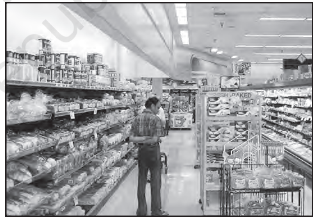
चित्र 6.3 : अमेरिका में डिब्बाबंद आहार बाजार

नगरीय बाजार केंद्रों में और अधिक विशिष्टीकृत नगरीय सेवाएँ मिलती हैं। इनमें न केवल साधारण वस्तुएँ और सेवाएँ बल्कि लोगों द्वारा वांछित अनेक विशिष्ट वस्तुएँ व सेवाएँ भी उपलब्ध होती हैं। नगरीय केंद्र, इसलिए विनिर्मित पदार्थों के साथ-साथ विशिष्टीकृत बाजार भी प्रस्तुत करते हैं जैसे श्रम बाजार, आवासन, अर्ध-निर्मित एवं निर्मित उत्पादों का बाजार। इनमें शैक्षिक संस्थाओं और व्यावसायिकों की सेवाएँ जैसे— अध्यापक, वकील, परामर्शदाता, चिकित्सक, दाँतों का डॉक्टर और पशु चिकित्सक आदि उपलब्ध होते हैं।