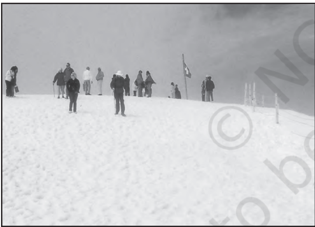
चित्र 6.5 : स्विट्जरलैंड में बर्फ से ढकी पर्वत चोटी पर स्कींग करते पर्यटक

पर्यटन एक यात्रा है जो व्यापार की बजाय प्रमोद के उद्देश्यों के लिए की जाती है। कुल पंजीकृत रोजगारों तथा कुल राजस्व (सकल घरेलू उत्पाद का 40 प्रतिशत) की दृष्टि से यह विश्व का अकेला सबसे बड़ा (25 करोड़) तृतीयक क्रियाकलाप बन गया है। इनके अतिरिक्त पर्यटकों के आवास, भोजन, परिवहन, मनोरंजन तथा विशेष दुकानों जैसी सेवा उपलब्ध कराने के लिए अनेक स्थानीय व्यक्तियों को नियुक्त किया जाता है। पर्यटन अवसंरचना उद्योगों, फुटकर व्यापार तथा शिल्प उद्योगों (स्मारिका) को पोषित करता है। कुछ प्रदेशों में पर्यटन ऋतुनिष्ठ होता है क्योंकि अवकाश की अवधि अनुकूल मौसमी दशाओं पर निर्भर करती है, किंतु कई प्रदेश वर्षपर्यंत पर्यटकों को आकर्षित करते हैं।