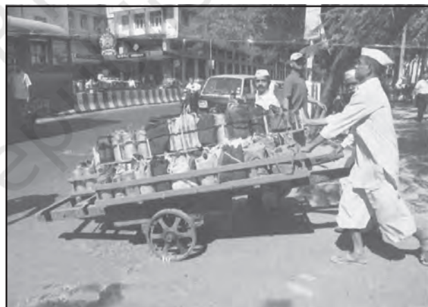
चित्र 6.4 : मुंबई में डब्बावाला सेवा

दैनिक जीवन में काम को सुविधाजनक बनाने के लिए लोगों को व्यक्तिगत सेवाएँ उपलब्ध कराई जाती हैं। कामगार रोजगार की तलाश में ग्रामीण क्षेत्रों से प्रवास करते हैं और अकुशल होते हैं। वे मोची, गृहपाल, खानसामा और माली जैसी घरेलू सेवाओं के लिए नियुक्त किए जाते हैं और इन्हें कम भुगतान किया जाता है। कर्मियों का यह वर्ग असंगठित है। ऐसा एक उदाहरण मुंबई की डब्बावाला सेवा है जो पूरे नगर में लगभग 1,75,000 उपभोक्ताओं को उपलब्ध कराई जाती है।