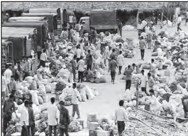
चित्र 6.2 : सब्जियों का थोक बाजार

ग्रामीण विपणन केंद्र निकटवर्ती बस्तियों का पोषण करते हैं। ये अर्ध-नगरीय केंद्र होते हैं। ये अत्यंत अल्पवर्धित प्रकार के व्यापारिक केंद्रों के रूप में सेवा करते हैं। यहाँ व्यक्तिगत और व्यावसायिक सेवाएँ सुविक्सित नहीं होतीं। ये स्थानीय संग्रहण और वितरण केंद्र होते हैं। इनमें से अधिकांश केंद्रों में मंडियाँ (थोक बाजार) और फुटकर व्यापार क्षेत्र भी होते हैं। ये स्वयं में नगरीय केंद्र नहीं हैं किंतु ग्रामीण लोगों की अधिक माँग वाली वस्तुओं और सेवाओं को उपलब्ध कराने वाले महत्त्वपूर्ण केंद्र हैं।