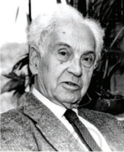
एरनस्ट मेयर (1904 - 2004)

एरनस्ट मेयर का जन्म 5 जुलाई, 1904 में केंपटन, जर्मनी में हुआ था। आप हावर्ड विश्वविद्यालय के विकासपरक जीव वैज्ञानिक थे, जिन्हें '20वीं शती का डार्विन' कहा गया। आप अब तक के 100 महान वैज्ञानिकों में से एक थे। मेयर ने सन् 1953 में हावर्ड विश्वविद्यालय की कला एवं विज्ञान संकाय में नौकरी प्राप्त की और 1975 में एलेक्जेंडर अगासीज प्रोफ़ेसर ऑफ़ जुलोजी एमीरिटस की पदवी के साथ अवकाश प्राप्त किया। अपने 80 सालों के कार्य जीवन में आपका पक्षी-विज्ञान, वर्गीकरण-विज्ञान, प्राणि-भूगोल, विकास, वर्गिकी तथा जीव विज्ञान के इतिहास एवं दर्शन आदि पर अनुसंधान केंद्रित रहा। आप ने लगभग अकेले ही विकासीय जीव विज्ञान के केंद्रीय प्रश्न जाति विविधता की उत्पत्ति को खड़ा किया, जो कि आज सच है। इसके साथ ही आपने हाल ही में स्वीकृत जीव वैज्ञानिक जाति वर्गिकी की परिभाषा की अगुवाई की। मेयर को तीन पुरस्कार दिए गए, जिन्हें व्यापक तौर पर जीव विज्ञान के तीन ताजों की संज्ञा दी जाती है: 1983 में बालजॉन प्राइज, 1998 में जीव विज्ञान के लिए इंटरनेशनल प्राइज और 1999 में क्राफ़र्ड प्राइज। मेयर ने 100 वर्ष की आयु में 2004 को स्वर्गवासी हुए।