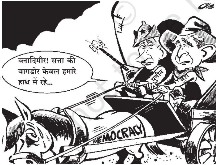
सत्ता की बागडोर

2005 में रूस में कुछ नए कानून बने हैं। इन कानूनों को बनाकर रूस के राष्ट्रपति को कुछ और शक्तियाँ सौंपी गई हैं। इसी वक्त अमरीकी राष्ट्रपति ने रूस का दौरा किया था। ऊपर दिए गए कार्टून के अनुसार लोकतंत्र और सत्ता के केंद्रीकरण में क्या संबंध है? यहाँ जिस चीज़ की तरफ़ ध्यान खींचा गया है उसकी पुष्टि में क्या आप कुछ और कार्टून जुटा सकते हैं?