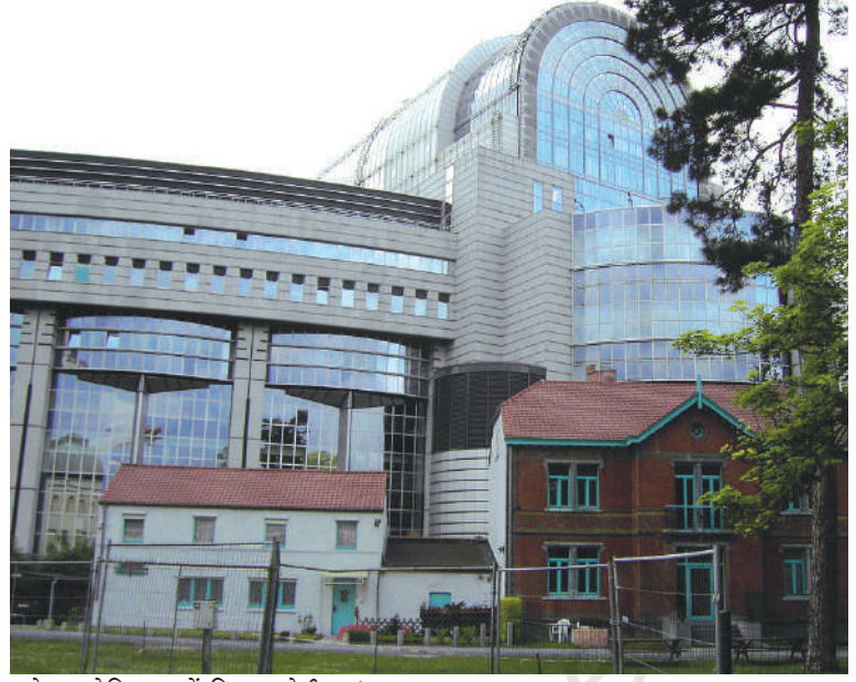
ब्रूसेल्स, बेल्जियम में स्थित यूरोपीय संसद

आपको बेल्जियम का मॉडल कुछ जटिल लग सकता है। निश्चित रूप से यह जटिल है—खुद बेल्जियम में रहने वालों के लिए भी। पर यह व्यवस्था बेहद सफल रही है। इससे मुल्क में गृहयुद्ध की आशंकाओं पर विराम लग गया है वरना गृहयुद्ध की स्थिति में बेल्जियम भाषा के आधार पर दो टुकड़ों में बँट गया होता। जब अनेक यूरोपीय देशों ने साथ मिलकर यूरोपीय संघ बनाने का