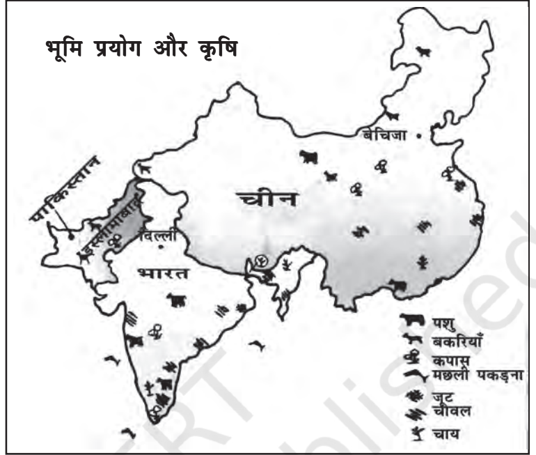
चित्र 8.2 भारत, चीन तथा पाकिस्तान में भूमि-प्रयोग तथा कृषि (स्केल के अनुसार नहीं)

चीन में प्रजनन दर भी बहुत कम है और पाकिस्तान में बहुत अधिक। चीन में नगरीकरण अधिक है। भारत में नगरीय क्षेत्रों में 34 प्रतिशत लोग रहते हैं।