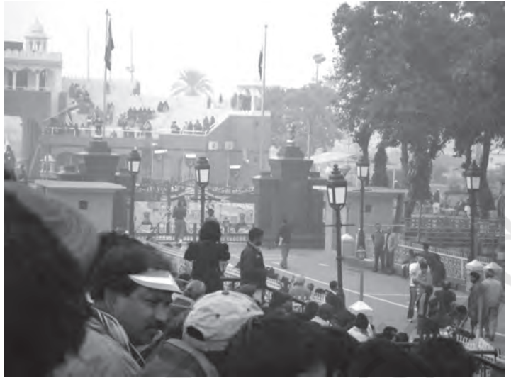
चित्र 8.1 बाधा बॉर्डर केवल पर्यटन स्थल ही नहीं बल्कि भारत तथा पाकिस्तान के

पाकिस्तान: द्वारा अपनायी गई विभिन्न आर्थिक नीतियों पर विचार करते हुए आप यह देखेंगे