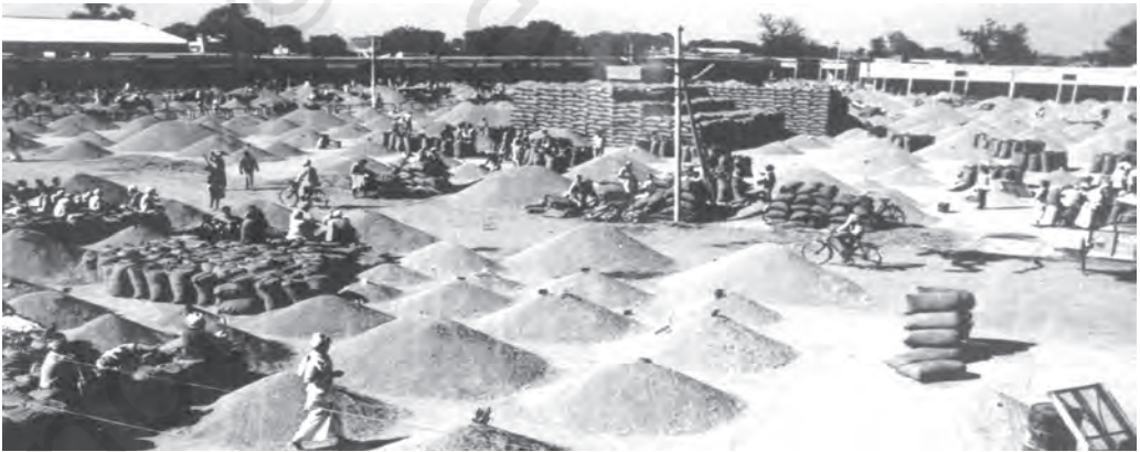
चित्र 5.1 नियमित अनाज मंडियाँ किसानों और उपभोक्ताओं को लाभ पहुँचाती हैं

स्वतंत्रतापूर्व व्यापारियों को अपना उत्पादन बेचते समय किसानों को तोल में हेरा फेरी तथा खातों में गड़बड़ी का सामना करना पड़ता था। प्रायः किसानों को बाज़ार में प्रचलित भावों का पता नहीं होता था और उन्हें अपना माल बहुत