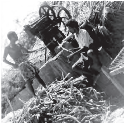
चित्र 5.2 गुड़ निर्माण कृषि क्षेत्रक का एक संबद्ध क्रियाकलाप है

आवश्यकता इसलिए उत्पन्न हो रही है, क्योंकि सिर्फ खेती के आधार पर आजीविका कमाने में जोखिम बहुत अधिक हो जाता है। अतः विविधीकरण द्वारा हम न केवल खेती से जोखिम को कम करने में सफल होंगे बल्कि ग्रामीण जन समुदाय को उत्पादक और वैकल्पिक धारणीय आजीविका