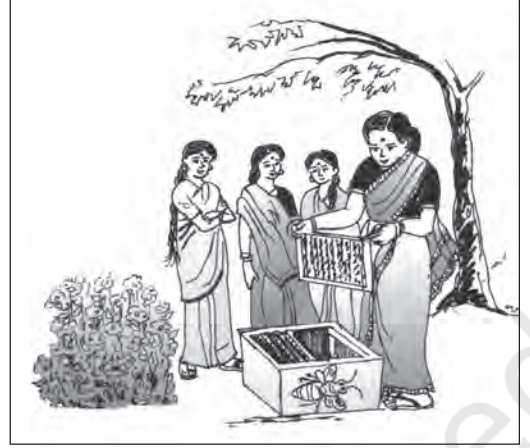
चित्र 5.5 ग्रामीण परिवार में महिलाएँ मधुमक्खी पालन को एक उद्यम क्रिया के रूप में ले सकती हैं

मत्स्य पालन: मछुआरों के समुदाय तो प्रत्येक जलागार को 'माँ' या 'दाता' मानते हैं। सागर-महासागर, सरिताएँ, झीलें, प्राकृतिक तालाब, प्रवाह आदि सभी जलागार मछुआरों के समाज के लिए निश्चित जीवन दीपक स्रोत बन जाते हैं। भारत में बजटीय प्रावधानों में वृद्धि और मत्स्य पालन एवं जल कृषिकी में नवीन प्रौद्योगिकी के प्रवेश के बाद से मत्स्य उद्योग ने विकास की नई मंजिलें तय की हैं। आजकल देश के समस्त मत्स्य उत्पादन का 65 प्रतिशत अंतर्वर्ती क्षेत्रों से तथा 35 प्रतिशत महासागरीय क्षेत्रों से प्राप्त हो रहा है। यह मत्स्य उत्पादन सकल घरेलू उत्पाद का 0.9 प्रतिशत है। मत्स्य उत्पादकों में प्रमुख राज्य पं. बंगाल, केरल, गुजरात, महाराष्ट्र