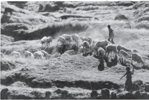
चित्र 5.3 ग्रामीण क्षेत्रों में भेड़ पालन आय वृद्धि का महत्वपूर्ण स्रोत है

पर्यटन आदि सम्मिलित हैं। कुछ ऐसे क्षेत्रक भी हैं जिनमें संभावनाएँ तो विद्यमान हैं, पर जिनके लिए संरचनात्मक सुविधाएँ तथा अन्य सहायक कार्यों का नितांत अभाव है। इस वर्ग में हम परंपरागत गृह उद्योगों को रख सकते हैं जैसे, मिट्टी के बर्तन बनाना, शिल्प कलाएँ, हथकरघा आदि। यद्यपि, अधिकांश ग्रामीण महिलाएँ कृषि में रोजगार प्राप्त करती हैं, जबकि पुरुष गैर-कृषि रोजगार की तलाश में है। किंतु, हाल के वर्षों में ग्रामीण महिलाएँ भी गैर कृषि कार्यों की ओर अग्रसर होने लगी हैं (देखें बॉक्स 5.2)।