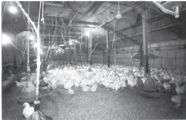
चित्र 5.4 भारत में मुर्गी पालन का पशुधन में सबसे अधिक भाग है

और तमिलनाडु हैं। मछुआरों के परिवारों का एक बड़ा हिस्सा निर्धन है। इस वर्ग में व्याप्त निम्न रोजगार, निम्न प्रतिव्यक्ति आय, अन्य कार्यों की ओर श्रम के प्रवाह का अभाव, उच्च निरक्षरता दर तथा गंभीर ऋण-ग्रस्तता इन मछुआरा समुदाय से आजकल जूझ रहे हैं। यद्यपि महिलाएँ मछलियाँ पकड़ने के काम में नहीं लगी हैं, पर 60 प्रतिशत निर्यात और 40 प्रतिशत आंतरिक मत्स्य व्यापार का संचालन उन्हीं के हाथों में है। विपणन के लिए आवश्यक पूँजी जुटाने में मछुआरा समुदाय की महिलाओं की सहायता के लिए सहकारिताओं और स्वयं सहायता समूहों के माध्यम से साख सुविधाओं का विस्तार किए जाने की आवश्यकता अब अनुभव हो रही है।