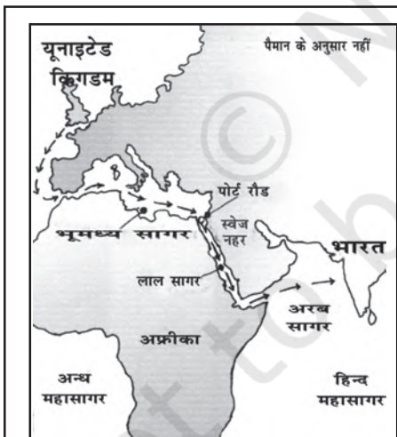
चित्र 1.2 स्वेज नहर: भारत और इंग्लैंड के बीच राजमार्ग के रूप में प्रयुक्त स्वेज नहर

ब्रिटिश भारत की जनसंख्या के विस्तृत ब्यौरे सबसे पहले 1881 की जनगणना के तहत