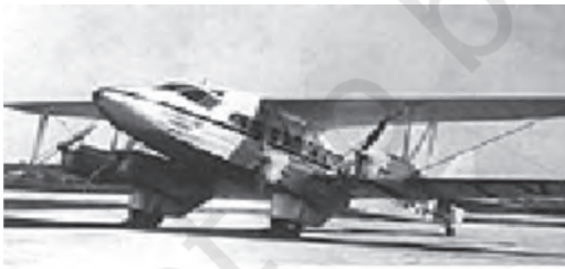
चित्र 1.5 टाटा एयरलाइंस: टाटा संस के विभाग के रूप में इस कंपनी की स्थापना से 1932 में भारत में उड़यन क्षेत्र की नींव रखी गई

स्वतंत्रता प्राप्ति तक, 200 वर्षों के विदेशी शासन का प्रभाव भारतीय अर्थव्यवस्था के प्रत्येक आयाम पर अपनी पैठ बना चुका था। कृषि क्षेत्रक पहले से ही अत्यधिक श्रम-अधिशेष के भार से लदा था। उसकी उत्पादकता का स्तर भी बहुत कम था। औद्योगिक क्षेत्रक भी आधुनिकीकरण वैविध्य, क्षमता संवर्धन और सार्वजनिक निवेश में वृद्धि की माँग कर रहा