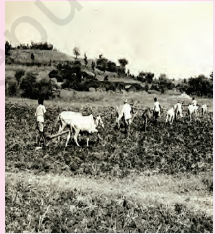
चित्र 1.1: ब्रिटिश औपनिवेशिक शासन के अंतर्गत भारत में कृषि में गतिहीनता

सत्रहवीं शताब्दी में भारत आए फ्रांसीसी यात्री बर्नीयर ने तत्कालीन बंगाल का इस प्रकार वर्णन किया है- “अपने दो बार के भ्रमण के दौरान बंगाल के विषय में संगृहीत जानकारी के आधार पर मैं कह सकता हूँ कि यह क्षेत्र मिश्र देश से कहीं अधिक समृद्ध है। यहाँ से सूती-रेशमी वस्त्र, चावल, शक्कर और मक्खन का प्रचुर मात्रा में निर्यात होता है। यहाँ अपने आंतरिक उपभोग के लिए भी गेहूँ, सब्जियाँ, अनाज, मुर्गे/मुर्गियाँ, बत्तख आदि का भरपूर उत्पादन होता है। यहाँ सूअरों के बड़े-बड़े झुंड तथा भेड़-बकरियों के विशाल झुंड भी विद्यमान हैं। इस क्षेत्र में हर प्रकार की मछलियाँ प्रचुरता में उपलब्ध हैं। राजमहल से लेकर समुद्र तक अतीत में परिवहन तथा सिंचाई के लिए गंगा नदी से (बहुत यत्न और श्रमपूर्वक) काट कर बनाई गई नहरों का जाल-सा बिछा हुआ है।”