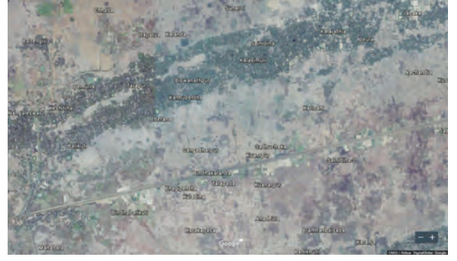
आकृती ७.१ (आ)

आकृती ७.१ 'अ' आणि 'आ' या उपग्रहीय प्रतिमांमधील वस्त्या नागरी आहेत की ग्रामीण ते सांगा.