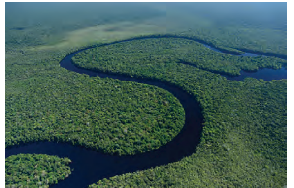
आकृती ७.४ : अॅमेझॉन नदी – वन