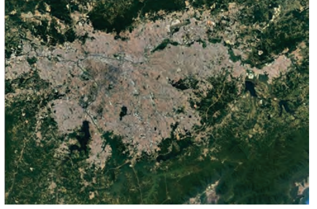
आकृती ७.२ (आ) : सावो पावलो शहर प्रतिमा

कॉफीच्या उत्पादनासाठी हा प्रदेश सुयोग्य आहे. या प्रदेशात खनिजाचा मुबलक साठा आहे. या ठिकाणी ऊर्जेचा अखंडित पुरवठा होतो. येथे वाहतुकीच्या सोईही चांगल्या विकसित झाल्या आहेत. वरील सर्व कारणांमुळे सावो पावलो येथे मानवी वस्ती केंद्रित झालेली आढळते. आकृती ७.३ पहा.