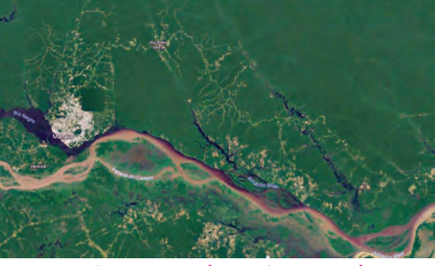
आकृती ७.२ (अ) : अॅमेझॉन नदीचा सखल प्रदेश