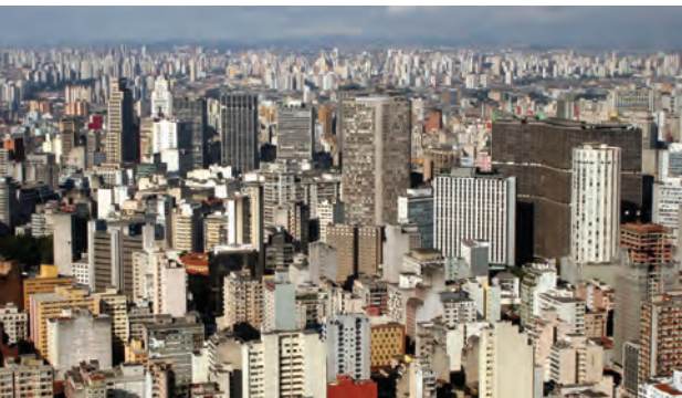
आकृती ७.३ : सावो पावलो शहर