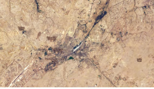
आकृती ७.१ (अ)

भारतातील वस्त्यांच्या आकृतिबंधाची उदाहरणे :