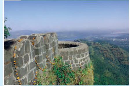
आकृती १.१३ : सिंहगडावरून दिसणारा खडकवासला धरणाचा जलाशय