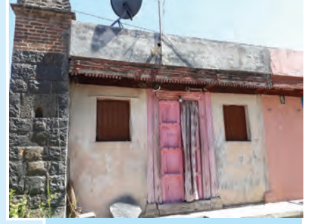
आकृती १.४ : धाब्याचे घर