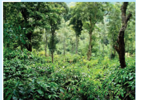
आकृती १.२१ : वनराई