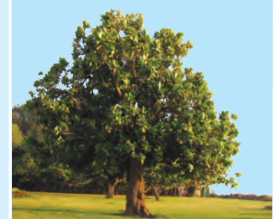
आकृती १.१० : वृक्ष प्रकार