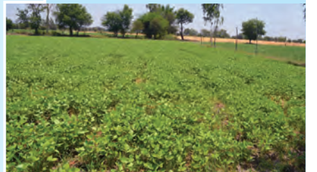
आकृती १.७ : कडधान्याची शेती