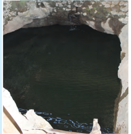
आकृती १.१६ : देवटाके