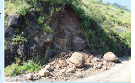
आकृती १.१२ : कोसळलेली दरड