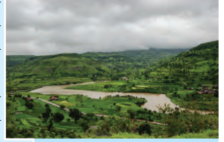
आकृती १.१५ : भातशेती

(लोणावळ्याच्या पुढे गेल्यावर राजमाची या ठिकाणी गाडी थांबवून शिक्षकांनी भूरचनेच्या वैशिष्ट्यांबाबतची पुढील माहिती दिली.)