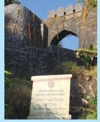
आकृती १.११ : सिंहगड प्रवेशद्वार

शिक्षिका : खूप छान ! आपण आता किल्ल्याच्या माथ्यावर आहोत. हा किल्ला पर्वतमाथ्यावर बांधला आहे. याला डोंगरी किल्ला