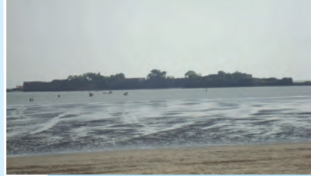
आकृती १.२३ : कुलाबा किल्ला

● समुद्रकिनारी गेल्यावर कोणती काळजी घ्यायची असते ? ● भरती-ओहोटीच्या वेळा समजून घेण्याची सोपी पद्धत कोणती ?