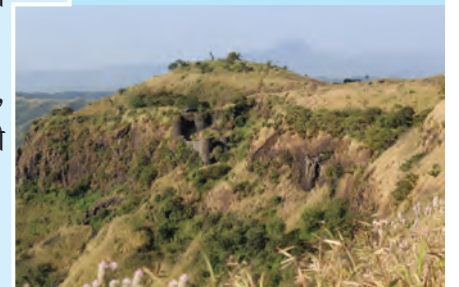
आकृती १.१४ : खडकाचे थर