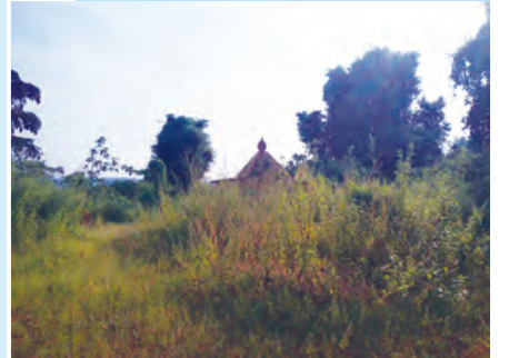
आकृती १.२० : देवराई