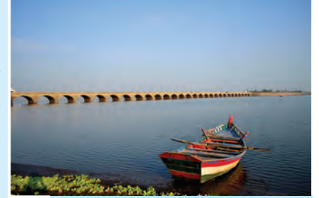
आकृती १.९ : उजनी धरणाचा जलाशय