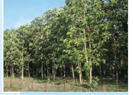
आकृती १.२२ : सागाची झाडे

शिक्षिका : हा किल्ला तरंगघर्षित मंचावर बांधला आहे. पाण्यानं वेढलेला असल्यामुळे अशा किल्ल्याला 'जलदुर्ग' म्हणतात. पूर्वी सागरकिनाऱ्याचं रक्षण करण्यासाठी असे किल्ले बांधले जात. पश्चिम