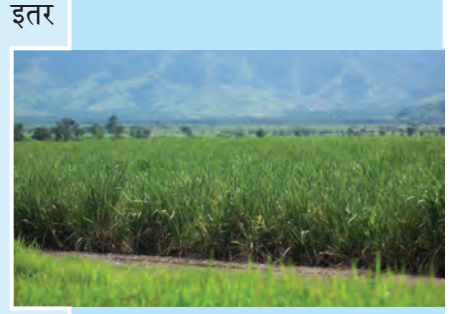
आकृती १.८ : उसाचे शेत

शिक्षिका : छान ! नळदुर्ग ओलांडताना निमओसाड प्रदेशात आढळणाऱ्या काटेरी वनस्पती दिसत होत्या. वनस्पतींच्या प्रकारामध्ये होणारा हा बदल त्या प्रदेशातील पर्जन्यमानाच्या प्रमाणातील बदलाचा सूचक आहे. आता आपण पाहतो आहोत ते अंजन, वड, पिंपळ इत्यादी वृक्ष जास्त प्रमाणात आहेत. आपण सिंहगडाच्या पायथ्याशी आहोत. सिंहगडाच्या माथ्यावर गेल्यावर सह्याद्री पर्वतापासून निघणाऱ्या डोंगररांगा दिसतात त्या पाहू. तुम्ही आपल्याबरोबर आता फक्त ओळखपत्र, वही, पेन, दुर्बीण, कॅमेरा, टोपी, नकाशा आणि पाण्याची बाटली इतकंच साहित्य घ्या. कपड्यांची बॅग व इतर साहित्य गाडीतच राहू द्या.