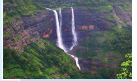
आकृती १.१९ : सह्याद्रीतील धबधबा