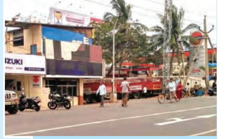
आकृती १.५ : रस्ता व दुकाने