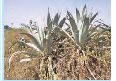
आकृती १.६ : शुष्क प्रदेशातील वनस्पती