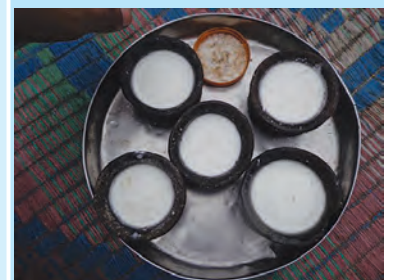
आकृती १.१७ : सिंहगडावरील खाद्यपदार्थ