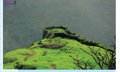
आकृती १.१८ : राजमाची

शिक्षिका : छान ! अलिबागला पोहोचल्यानंतर मुक्कामाच्या ठिकाणी जाण्यापूर्वी आपण तलाठी कार्यालयात जाणार आहोत. तिथे तुम्ही